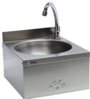
Preparación estática - Lavamanos - Lavamanos - Murales