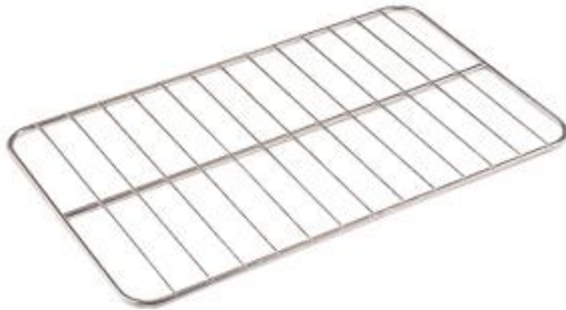
Distribución y exposición de alimentos - Gastronorm - Estantes de varilla - Estantes de varilla de acero inoxidable